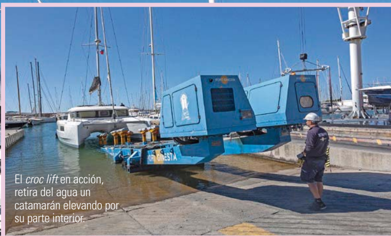
El croc lift en acción, retira del agua un catamarán elevando por su parte interior.

La rampa permite que el croc lift saque del agua catamaranes de grandes dimensiones, a su lado el travelift de 75 toneladas y la grúa para embarcaciones más pequeñas.