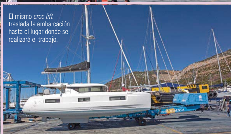
El mismo croc lift traslada la embarcación hasta el lugar donde se realizará el trabajo.